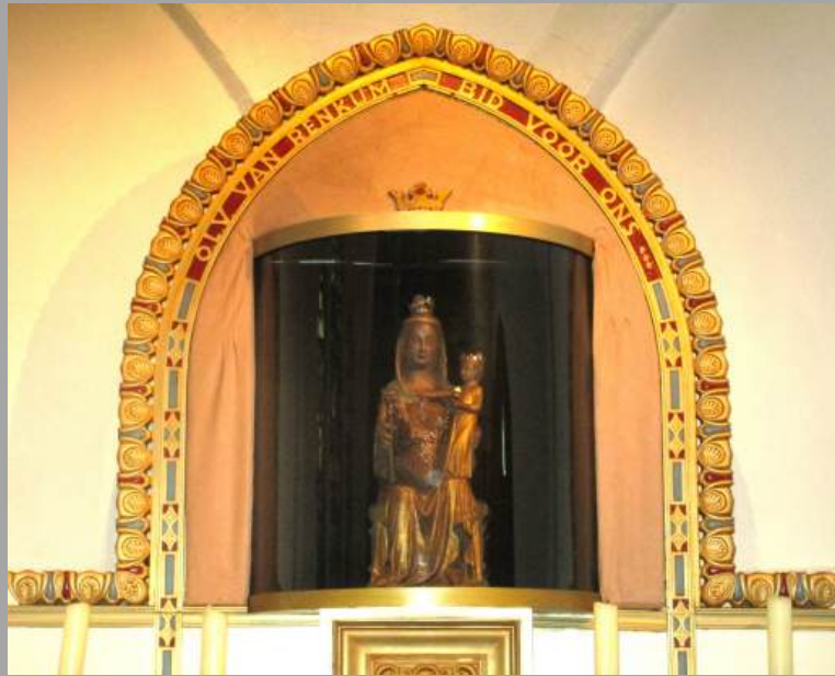
Onze Lieve Vrouw Ten Hemelopneming Renkum

van Onze Lieve Vrouw van Renkum een kaarsje op te steken en te bidden voor de goede afloop. En wat gebeurde er? Toen mijn moeder 's avonds mijn zusje naar bed bracht zag zij onder het rechtgezette oog op haar wangetje de hechtingen liggen... die er vanzelf (?) waren uitgegaan! Hoe kon dat? Voor mijn moeder was het duidelijk. Maria van Renkum had haar gebed verhoord. De volgende dag zijn ze nog naar Wageningen gegaan om in het ziekenhuis te laten controleren of alles in orde was. En ook daar waren ze vol verwondering