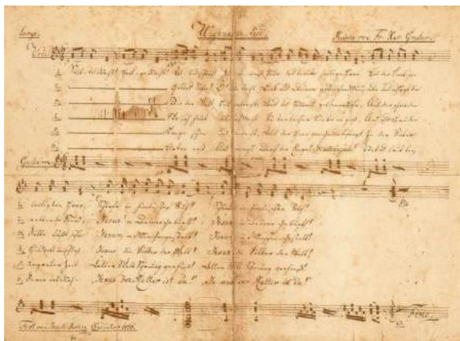
Autograaf Joseph Mohr, 1820-1825.