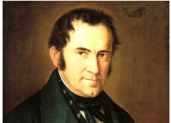
Franz Xaver Gruber (1787-1863)