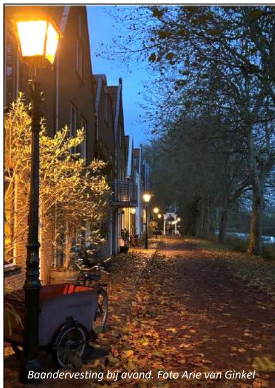
Baanderving bij avond.